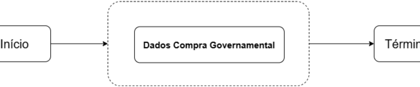
I - Fluxograma Exemplo