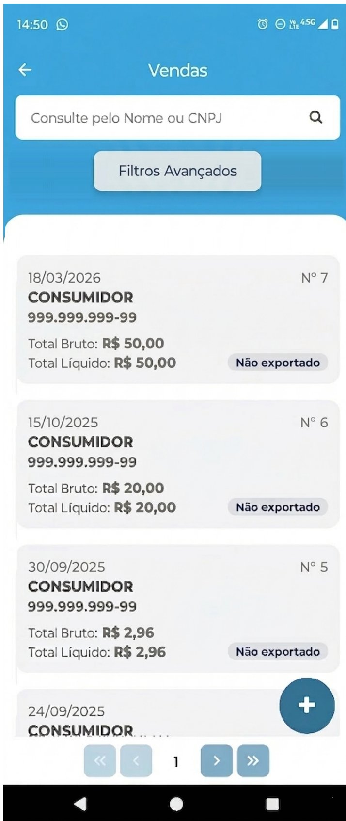
Imagem I - Tela de vendas com filtros avançados