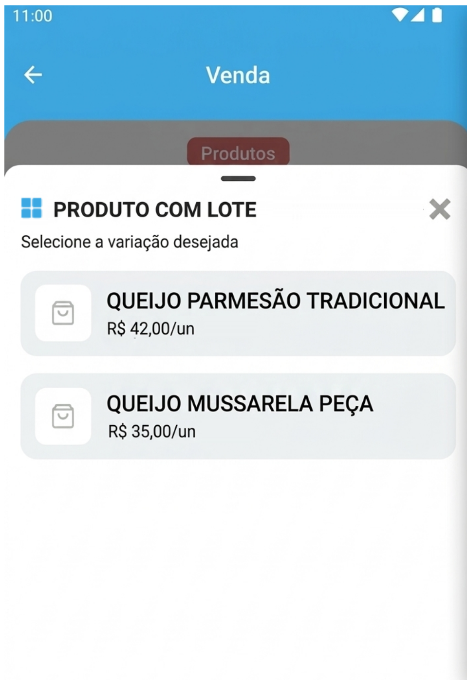
Imagem II - Seleção de Variação