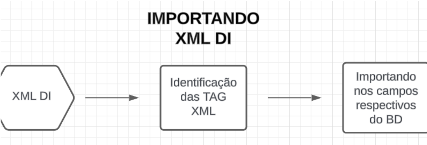
I - Fluxograma Exemplo