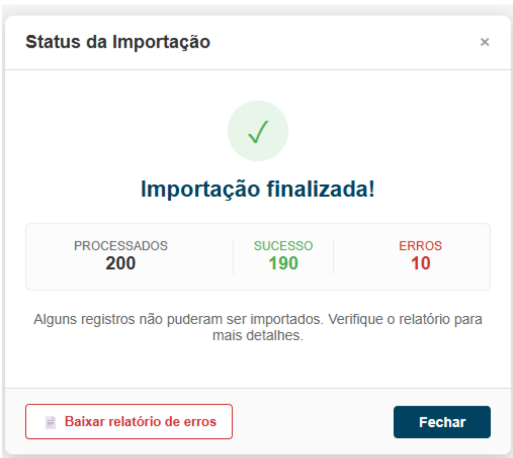
Imagem VI - Tela de resultado.